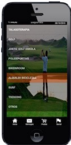
Propuesta de Actividades