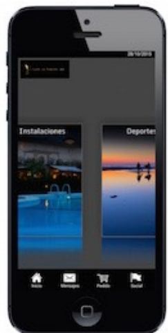
Información del entorno