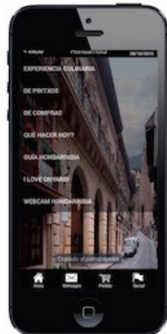
Lugares a Visitar