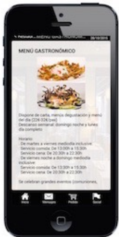
Menús, Carta, Ofertas